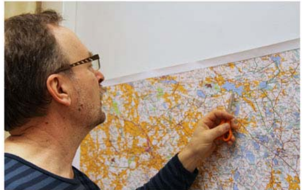
Avosairaalan välineistöön kuuluu mm. kartta ja tarpeellisilla tarvikkeilla pakattu laukku.

Viime vuonna heräsi myös keskustelu julkisen vallan käytöstä, tulkinnan mukaan ainoastaan virassa toimiva lääkäri voi harjoittaa julkista valtaa. Ongelmat tulevat esille lähinnä päivystysaikana, kun päivystyksessä joudutaan tekemään virka-apupyynnöjä tai päätöksiä vastentahtoisesta hoidosta. Sosiaali- ja terveysministeriöltä on tulossa tähän uusia ohjeita, siihen asti takapäivystäjän on tehtävä em. päätökset.