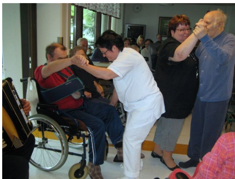
Vuodeosasto 21:llä vietettiin juhannusjuhlaa haitarimusiikin tahdissa.