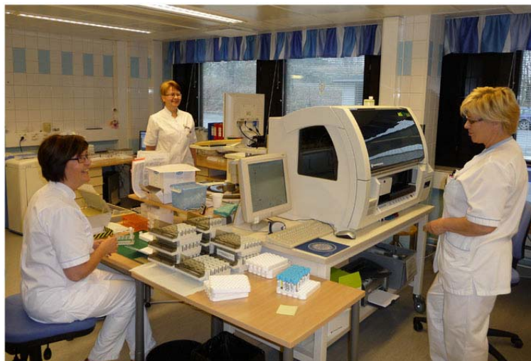
Kemian laitteiden viikkohuollon suunnittelua laboratoriossa.