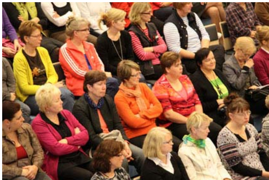
FSTKY:n Syyspäivän kuulijakuntaa Urheilutalo Feeniksissä 28.9.2010