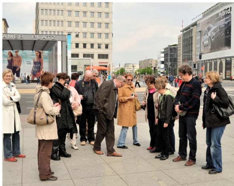
FSTKY:n henkilökuntaa vieraili toukokuussa Berliinissä tutustumassa St. Josefs-Krankenhaus Postdam-Sanssouci -sairaalaan. Kuvassa muurin paikka Potsdamin aukiolla.

Lyhytaikainen sijaistyövoima (alle 3 kuukautta) on vuodesta 2009 alkaen hankittu Seuturekry Oy:ltä, jonka omistavat Forssan kaupunki, Forssan seudun terveydenhuollon kuntayhtymä, Eteva kuntayhtymä ja Seutukeskus Oy Häme, osakkaanaan Hämeenlinnan kaupunki. Yhtiöllä on toimipiste myös Forssan seudun terveydenhuollon kuntayhtymän tiloissa. Seuturekry Oy:n palveluihin ja asetettuihin tavoitteisiin on oltu myös tämän toisen toimintavuoden aikana tyytyväisiä.