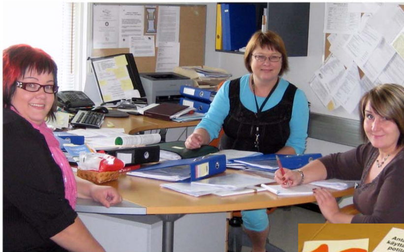
A-klinikan henkilökuntaa palaverissa

sekä jaettavaa materiaalia alkoholitiedosta.