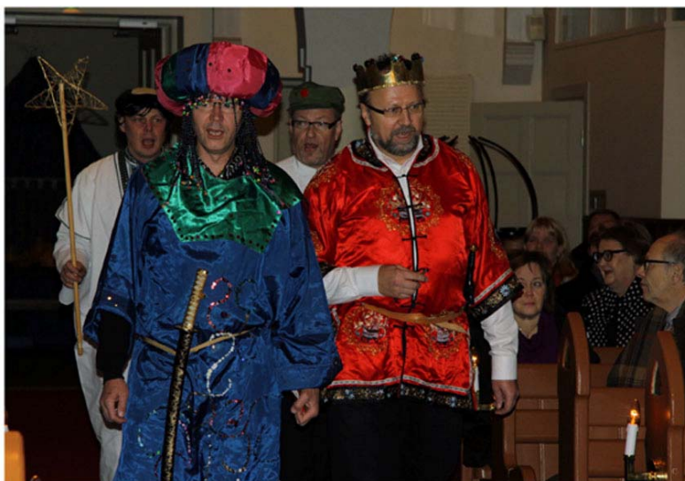
FSTKY:n omat Tiernapojat lauloivat työntekijöiden jouluhartaudessa Forssan kirkossa.