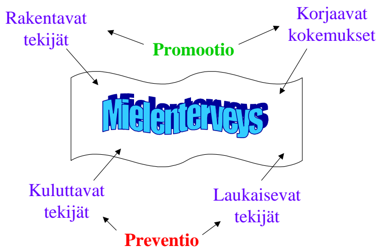
Kuvio 2. Mielensterveyden edistämistyön kokonaisuus.